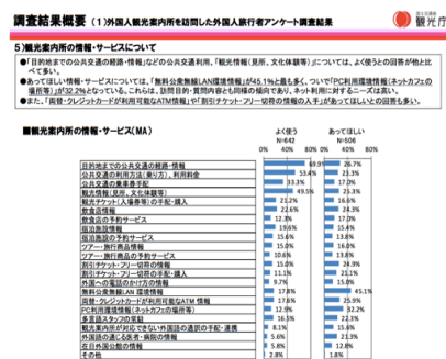
図1 日本政府観光局の外国人観光案内所を訪問した外国人旅行者アンケート調査

クールジャパン戦略の影響もあり、訪日外国人観光客数はここ数年順調に伸びており、昨年2016年には史上最多となる2,400万人の外国人観光客が日本を訪れた。特に昨年の訪日中国人旅行者はおよそ637万人で、前年比27.6%増となり、引き続き増加傾向にある。日本政府観光局(JNTO)によると、国籍・地域別に旅行消費額をみると、2016年中国が1兆4,754億円(構成比39.4%)と最も大きい。