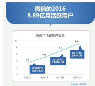
図2 2017年ウェイチャットユーザー&生態研究報告

国土交通省自動車局旅客課が2016年に行ったタクシーに関するアンケート調査によると、全国のタクシー会社の6割以上が赤字経営である。タクシー会社は非常に深刻な場状況である。